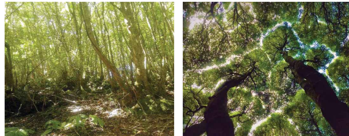
Imagem 2: Espécie invasora mais comum nos Açores: incenso ( Pittosporum undulatum ). Árvore com o tronco ramificado mostrando uma grande quantidade de biomassa, pormenor dos povoamentos muito densos e puros (esquerda), pormenor das copas das árvores (direita).

Usando estimativas médias de biomassa por hectare, as áreas classificadas como dominadas por P. undulatum no inventário florestal, e um período de rotação de 26 anos (para a renovação de um povoamento com cerca de 7 cm de diâmetro do tronco), calculámos um total anual de biomassa disponível de 1570, 2594 e 11903 toneladas por ano para as ilhas Graciosa, Terceira e de São Miguel, respetivamente (nos cálculos, por questões de sustentabilidade, apenas se considerou 65% da área total disponível). Neste contexto, embora tenha sido possível prever a biomassa disponível com base na densidade do povoamento e nas características dendrométricas, não houve uma relação clara entre a biomassa por hectare e as variáveis topográficas e climáticas, embora a diminuição da biomassa com altitude seja esperada devido à diminuição das taxas fotossintéticas e a um menor incremento anual no diâmetro do tronco. No entanto, a distribuição potencial de P.