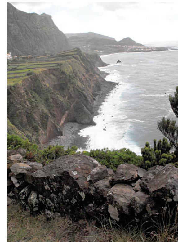
Imagem da Fajã Grande na ilha das Flores, uma ilha classificada como Reserva da Biosfera pela UNESCO

A equipa da Universidade dos Açores envolvida no projeto, tem desenvolvido na região inúmeras pesquisas sobre os impactos do turismo no meio ambiente e o valor dos